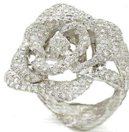
Qui sopra: anello Petali di rosa in oro bianco e diamanti. A sinistra: anello e orecchini scultura in oro bianco naturale non rodato con diamanti.